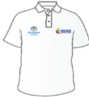
Ilustración No. 1. Camiseta

Gorra: Debe contener los logos de PROSPERIDAD SOCIAL bordado. Cada técnico dispondrá de una (1) unidad. Material Tela Ref. MICROPRINCE (Nacional-No Importada) bordadas. O en Tela Ref. ORION Base 2564. Diseño: De color azul con logo de PROSPERIDAD SOCIAL bordado en el frente. Medidas: Logo bordado Ancho 7.1cms x 6.5cms