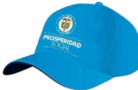
Ilustración No. 2. Gorra.

Chaleco: Debe contener los logos de Prosperidad Social y Todos por un Nuevo País bordados. Cada técnico dispondrá de una (1) unidad.